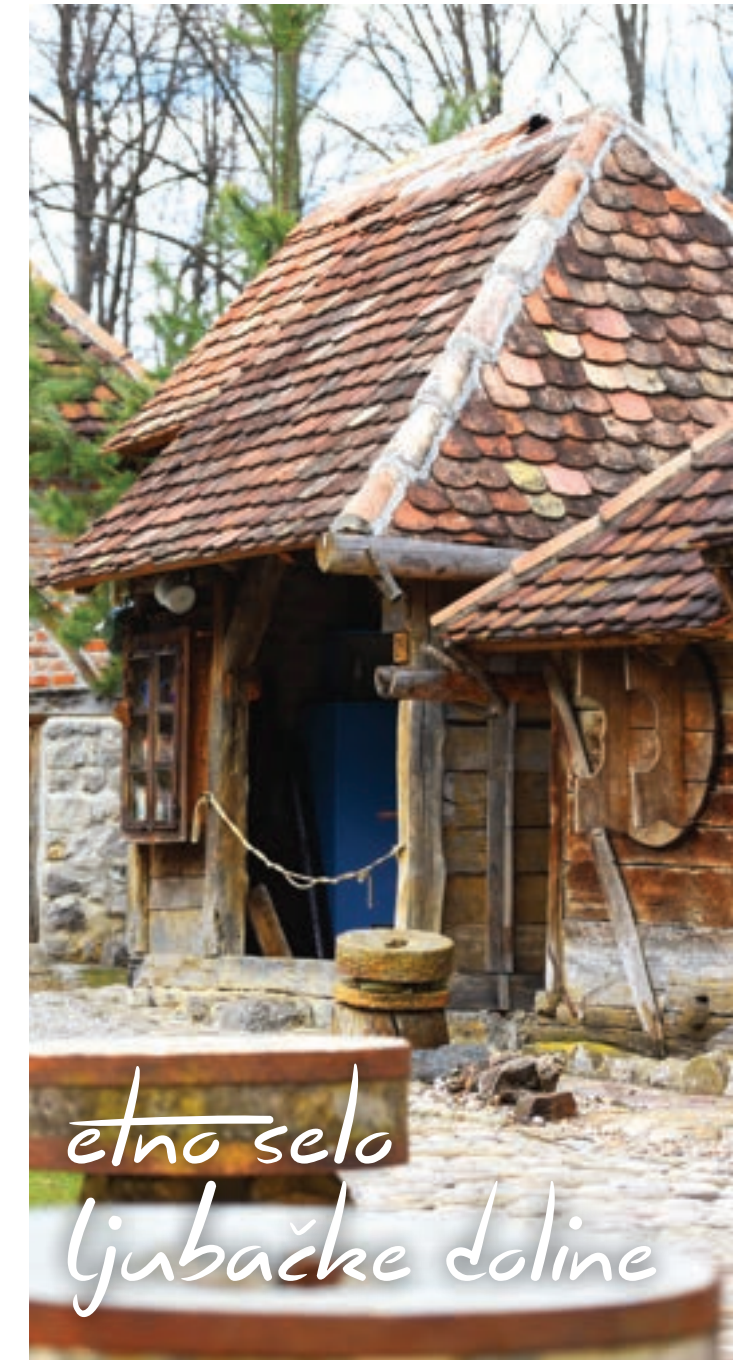
etno selo Ljubačke doline