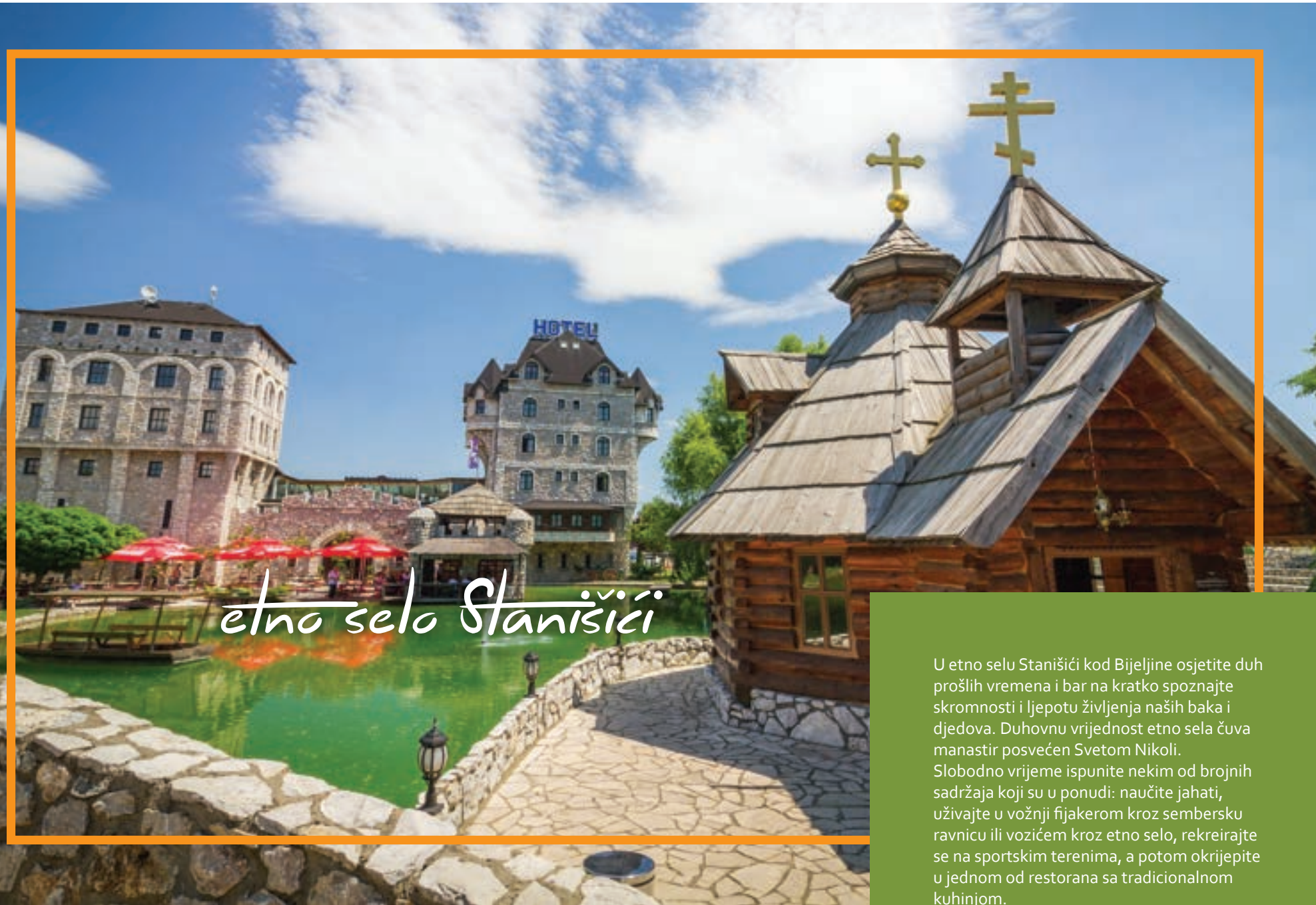
etno selo Stanišići

U etno selu Stanišići kod Bijeljine osjetite duh prošlih vremena i bar na kratko spoznajte skromnosti i ljepotu življenja naših baka i djedova. Duhovnu vrijednost etno sela čuva manastir posvećen Svetom Nikoli. Slobodno vrijeme ispunite nekim od brojnih sadržaja koji su u ponudi: naučite jahati, uživajte u vožnji fijakerom kroz sembersku ravnicu ili vozićem kroz etno selo, rekreirajte se na sportskim terenima, a potom okrijepite u jednom od restorana sa tradicionalnom kuhinjom.