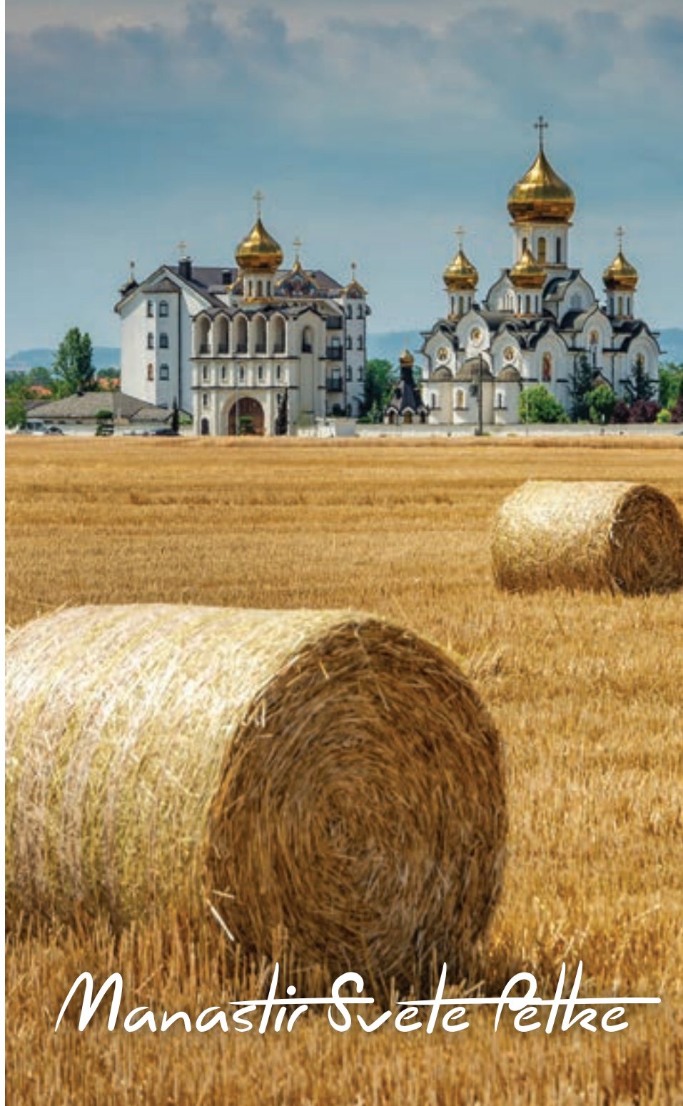
Manastir Svete Petke

Džamija Ferhadija- sagrađena 1579.godine obnovljena je i jedan je od najvrijednijih kulturno-istorijskih spomenka orijentalne arhitekture u BiH, a sagrađena je u duhu škole poznatog turskog neimara Sinana.