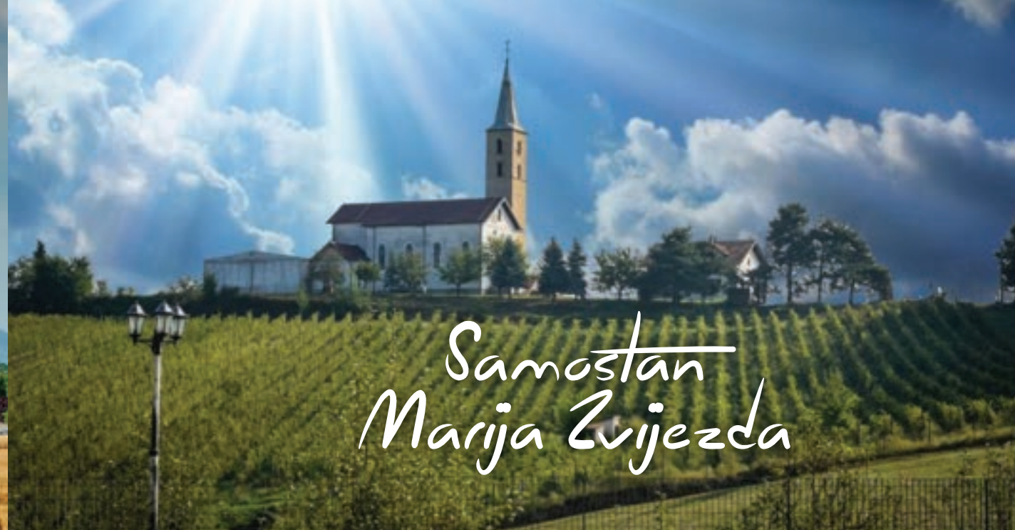
Samostan Marija Zvijezda