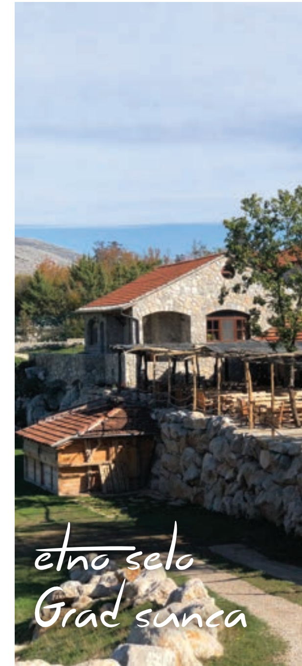
etno selo Grad sunca

Etno selo u „Gradu sunca“ u Trebinju je skriveno između modernih objekata, zelenih površina i sportskih sadržaja ovog kompleksa. U etno selu se služi tradicionalna hercegovačka hrana uparena sa vinima iz Hercegovine. Bogatu trpezu čini domaća hrana spremljena po pažljivo čuvanim hercegovačkim recepturama koje se prenose sa koljena na koljeno. Na drvenim astalima, pored ognjišta, gosti mogu da uživaju u specijalitetima poput teletine ispod sača, cicvare, priganica, siru iz ulja, kajmaku iz mješine, domaćoj hercegovačkoj rakiji, dok se najmlađi posjetioci bezbiržno zabavljaju u zoo vrtu koji se nalazi u neposrednoj blizini konobe.